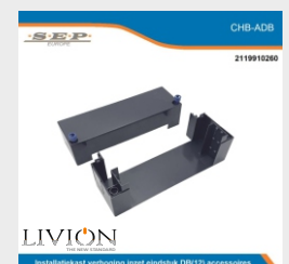
installatiekast verhoging inzet eindstuk DB (12) accessoires