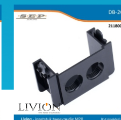
inzetstuk tweevoudig M20