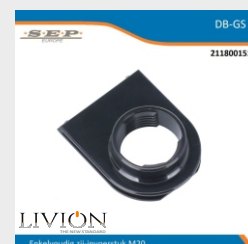
Enkelvoudig zij-invoerstuk M20