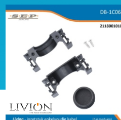
inzetstuk enkelvoudig kabel