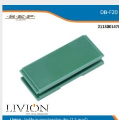
lasklem-montagehouder 2,5mm 2