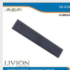
verdeler koppelspie horizontaal / verticaal