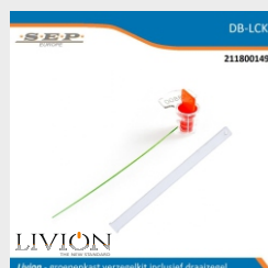
groepenkast verzegelkit inclusief draaizegel