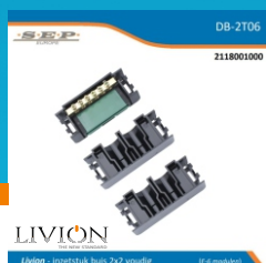
inzetstuk buis 2x2 voudig

De standaard invoeren kunnen worden vervangen door inzetstukken uit het LIVION assortiment