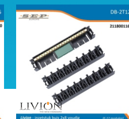
inzetstuk buis 2x8 voudig